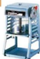
かき氷 電動/ブロックアイス型

●能力:1.8kg/m ●W310×D402×H580mm ●消費電力:210W ●質量:29kg 1D 13200 1W 26400