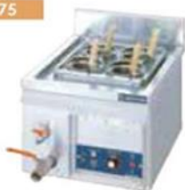
電気卓上ゆで麺器

●電源・消費電力:三相200V3kW ●W450×D550×H340mm ●質量:26kg 1W 45600