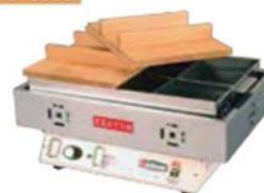
おでん鍋 電気/6つ切り

●消費電力:1kW ●40~110℃ ●質量:11kg ●W485×D340×H255mm 1D 12000 1W 24000