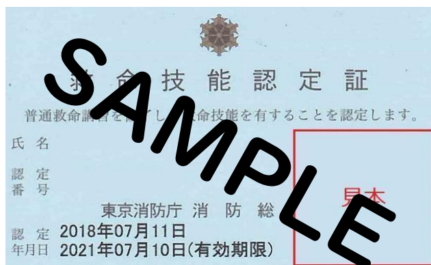
見本(東京消防庁発行の場合)